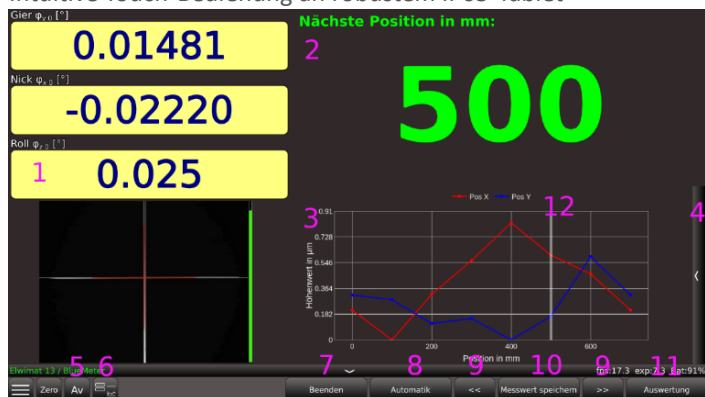
Bild: Touch Monitor mit Prozesssteuerung

Intuitive Touch-Bedienung an robustem IP65-Tablet